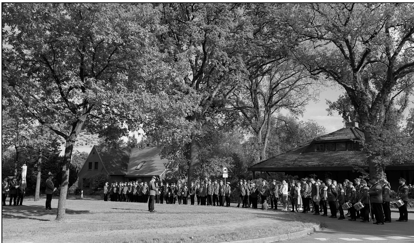
Kranzniederlegung am Ehrenmal in Handeloh am 19. Mai 2023.