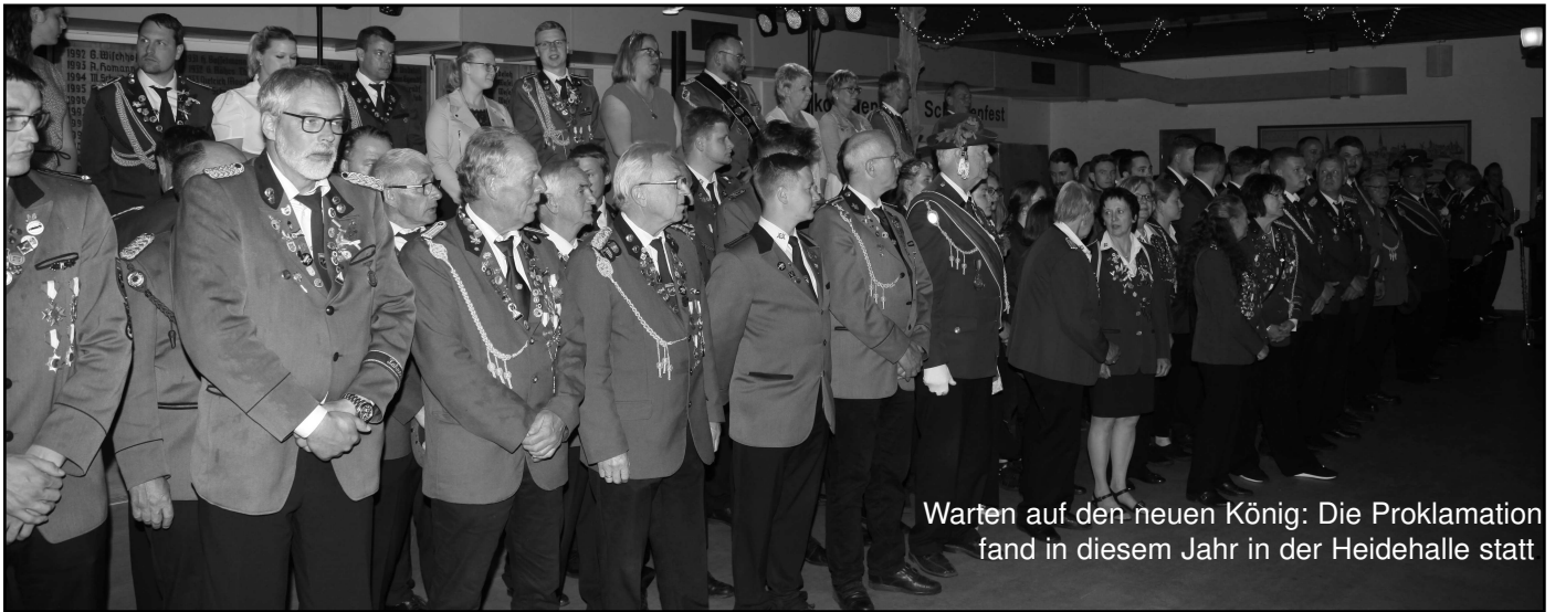
Warten auf den neuen König: Die Proklamation fand in diesem Jahr in der Heidehalle statt

Schützenfest - vom 19. Mai bis 22. Mai 2023