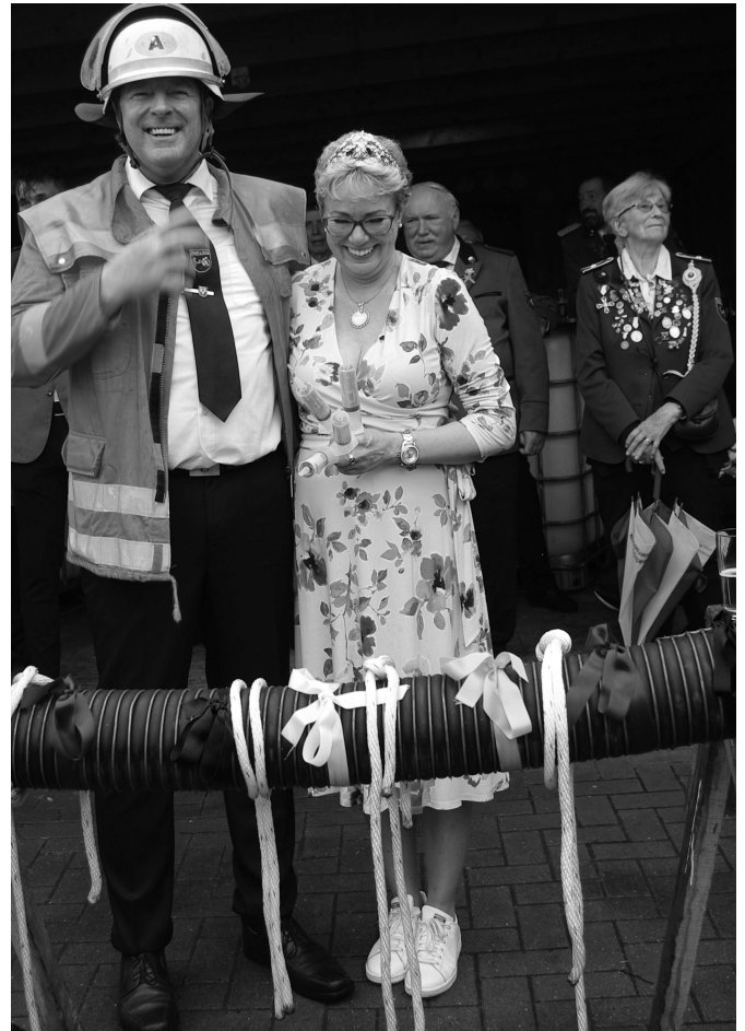
Rechts: Nachdem das Königspaar alle Aufgaben gelöst hatte wurde den beiden ein Schlauch überreicht, der mit Beton gefüllt war. Im Beton befand sich das zu übergebende Geld. Viel Spaß beim „Auspacken“.