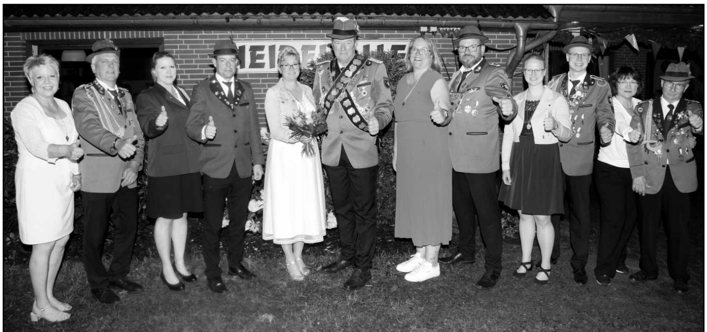
Das Königspaar mit seinen Adjutantenpaaren freuen sich auf ein erfolgreiches und spannendes Regierungsjahr.